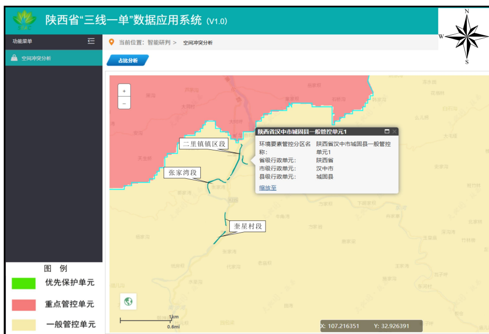
图1-1 项目与陕西省“三线一单”数据应用系统对比图