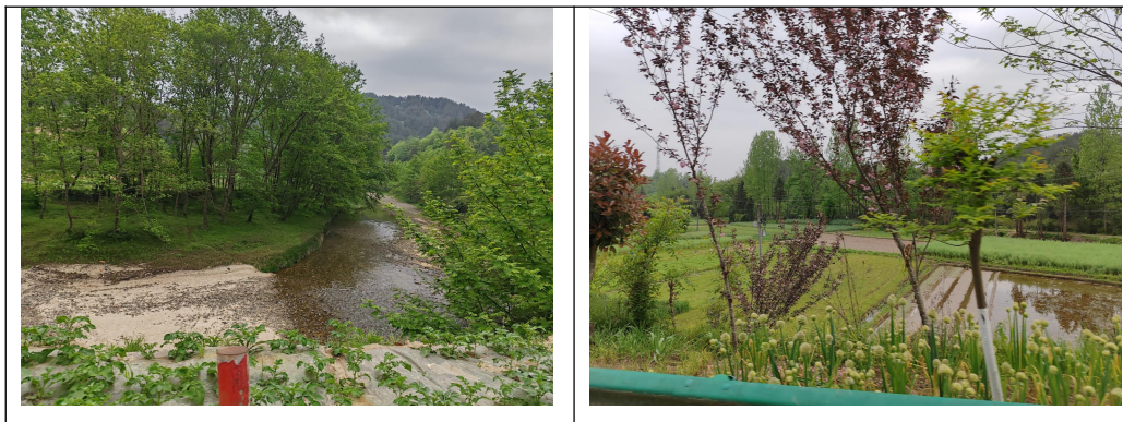
图 3-1 项目防洪区段植物资源现状

根据现场踏勘，项目区域为城固县汉江以南的平坝区，属于南沙河冲积平原区，为当地重要的农业区，种植模式为水稻—油菜或水稻—中药材，一年两熟。本次项目占地区目前为自然土堤，植被类型为常见杂灌木、枫杨（幼树）、马桑、火棘、狗尾草、野菊花等；均属于次生灌丛或次生草丛；河道湿地植物种类主要为香蒲、水蓼、水芹等；施工区外侧主要为农田生态系统，分布有小麦、水稻、玉米等粮食作物。属于当地常见植物种类，无野生保护植物分布。