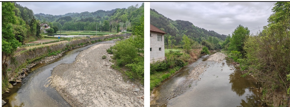
图 3-2 项目场地现状情况